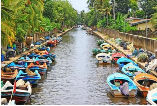
නවතා තැබීම සඳහා භාවිතා කරයි.

පුත්තලම සිට කොළඹ දක්වා දිවෙන හැමිල්ටන් ඇල (ඕලන්ද ඇල ලෙස ද හැඳින්වේ) ලන්දේසි යුගයේ ඉදිකරන ලද්දකි. ලන්දේසින් විසින් භාණ්ඩ ප්‍රවාහනය සඳහා මෙම ඇල භාවිතා කර ඇති අතර 1804 දී බ්‍රිතාන්‍යන් විසින් නැවත ප්‍රතිසංස්කරනය කර, රාජ්‍ය ආදායම් හා වාණිජ කටයුතු නියෝජිත බ්‍රිතාන්‍ය ජාතික ගැවින් හැමිල්ටන් නමින් නම් කරන ලදී. අද වනවිට මෙය ධීවර යාත්‍රා