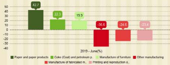
Significant changes by sector June 2019

Year on Year change (2019 June - 2018 June)